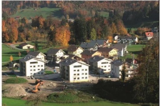
Überbauung Chilenmattli West, Ennetmoos

Tel. 041 660 56 58 bauen@melkdurrer.ch www.melkdurrer.ch